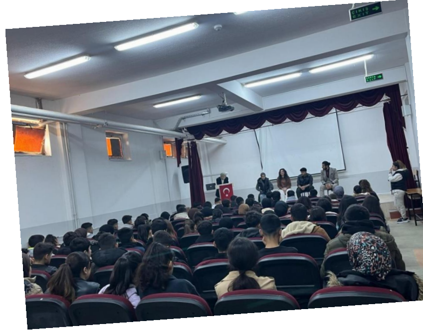
Kariyer Günleri Etkinliğimizden Kareler